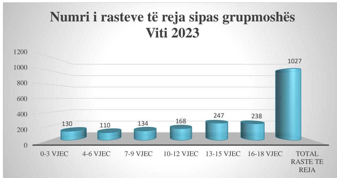
tabela e mëposhtme numrin më të madh të rasteve të reja të identifikuarra e zënë fëmijët e grupmoshës 13-15 vjeç .

Përsa i përket raportit gjinor të rasteve të reja të trajtuara nga NJMF për vitin 2023, kryeson gjinia mashkullore. Përqindja që zënë meshkujt në raport me numrin e rasteve të reja është 54% kundrejt femrave që zënë 46% të totalit. E shprehur në shifra 468 femra dhe 559 meshkuj.